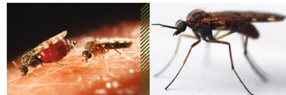
Мокрецы рода Culicoides

вирусная, трансмиссивная болезнь жвачных животных, характеризующаяся воспалительно-некротическими поражениями слизистой оболочки ротовой полости, особенно языка, желудочно-кишечного тракта и основы кожи копыт, а также дистрофией, изменениями скелетной мускулатуры.