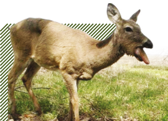
Отечность слизистых оболочек ротовой полости и языка