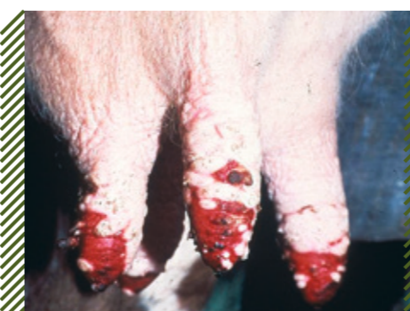
Экстенсивное сливное изъязвление кожи соска вымени у КРС