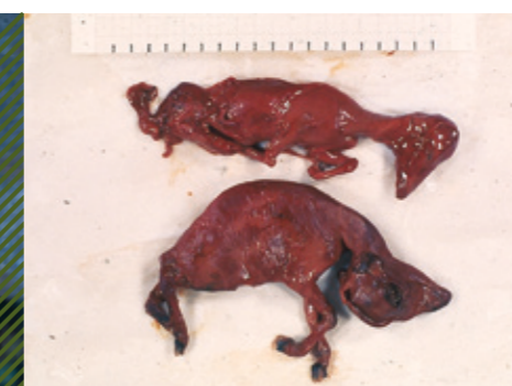
Абортированные мацерированные плоды с признаками тортиколлиса