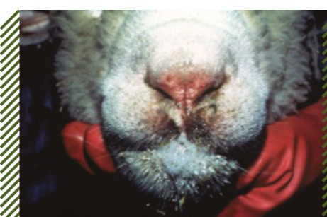
Эрозии крыльев носа и слюнотечение у МРС

Приказ Министерства сельского хозяйства РФ от 25 ноября 2020 г. N 706 "Об утверждении Ветеринарных правил осуществления профилактических, диагностических, ограничительных и иных мероприятий, установления и отмены карантина и иных ограничений, направленных на предотвращение распространения и ликвидацию очагов блютанга".