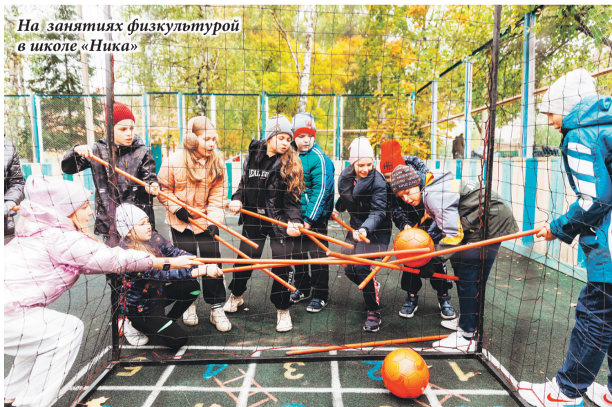
На занятиях физкультурой в школе «Ника»

– Хочу сказать спасибо нашим учителям за их нелёгкий и очень нужный труд! За их терпение и отзывчивость, за преданность своему делу. Во многом именно благодаря школьным учителям мы добиваемся поставленных целей и имеем успех во многих сферах жизни. Здоровья вам, благополучия, позитивных трудовых будней и домашнего тепла и уюта, замечательных, умных и благодарных учеников и неиссякаемой уверенности в огромной значимости вашего труда.